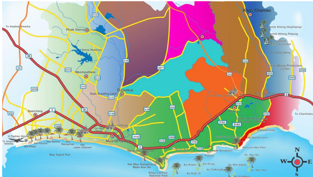
รูปที่ 2 แผนที่เส้นทางคมนาคมหลัก