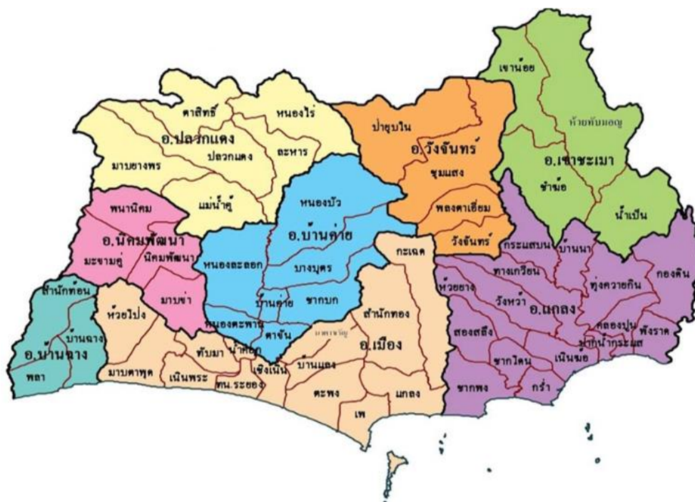
รูปที่ 1 แผนที่จังหวัดระยอง

ทิศตะวันตก ติดต่อเขตอำเภอสัตหีบ อำเภอบางละมุง จังหวัดชลบุรี