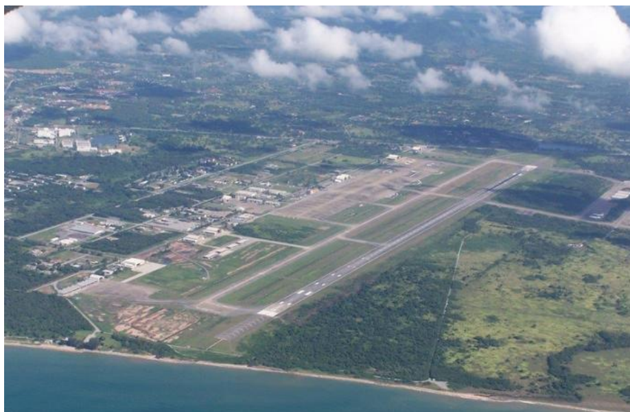
รูปที่ 3 สนามบินอุตะเภา ระยอง - พัทยา