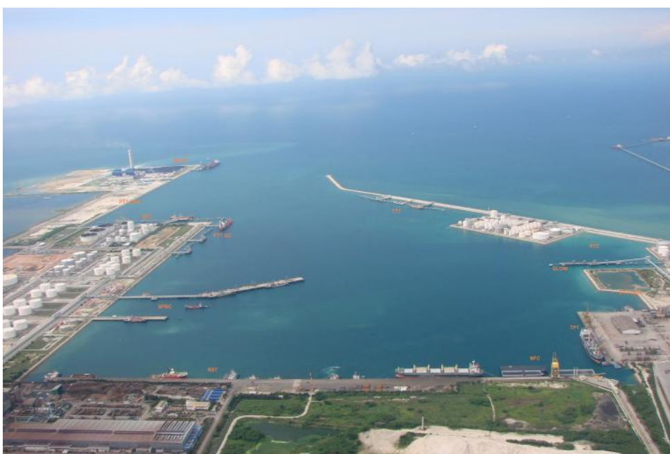
รูปที่ 4 ท่าเรืออุตสาหกรรมมาบตาพุด

3) ท่าเรือ ไออาร์พีซี ให้บริการเทียบเรือเพื่อขนถ่ายสินค้า พร้อมสิ่งอำนวยความสะดวก เพื่อให้บริการลูกค้าในการเทียบท่า เช่น เรือลากจูง บริการนำร่อง เรือบริการ เครื่องซั่ง ลานตู้สินค้าคอนเทนเนอร์ โกดังเก็บสินค้า เครื่องจักรและอุปกรณ์ในการขนถ่ายสินค้า เป็นต้น ความยาวประมาณ 1,623 เมตร ประกอบด้วยท่าเทียบเรือขนาดใหญ่ 6 ท่า สามารถรับเรือได้ตั้งแต่ขนาด 1,000 – 250,000 ตัน